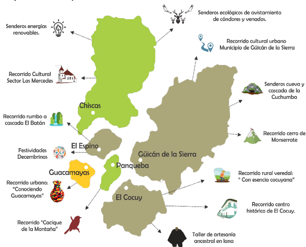
Mapa de atractivos y recursos turísticos de Gutiérrez

Nota. Cámara de Comercio de Duitama, 2017.