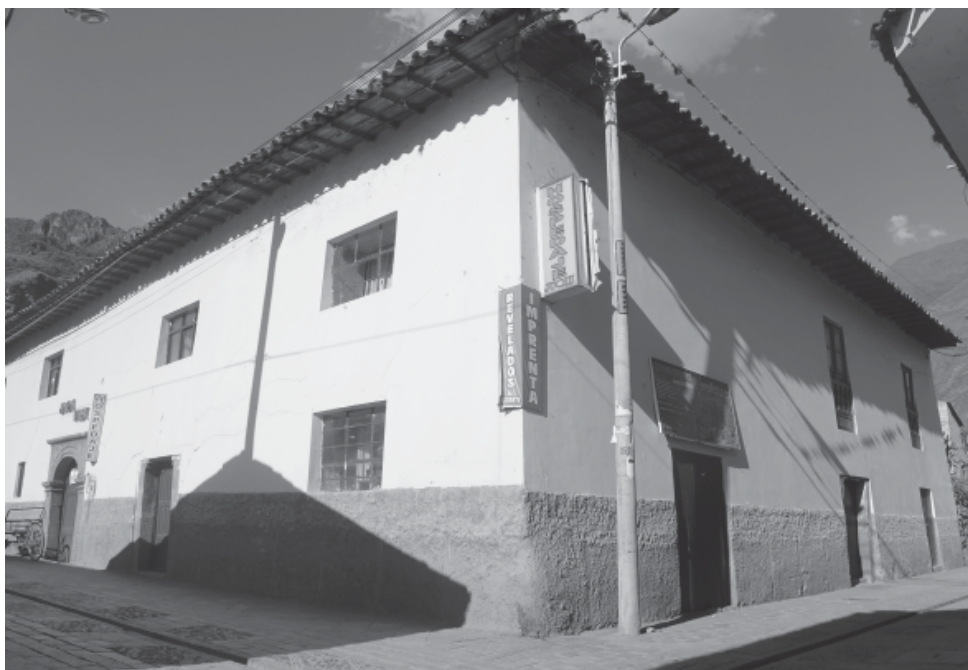
Figura 5. Vista panorámica de la Casona, hallada en regular estado de conservación, actualmente funcionan un hospedaje y una imprenta, sin que esto haya significado la modificación de los ambientes.

Fuente: Archivo fotográfico personal, 2016.