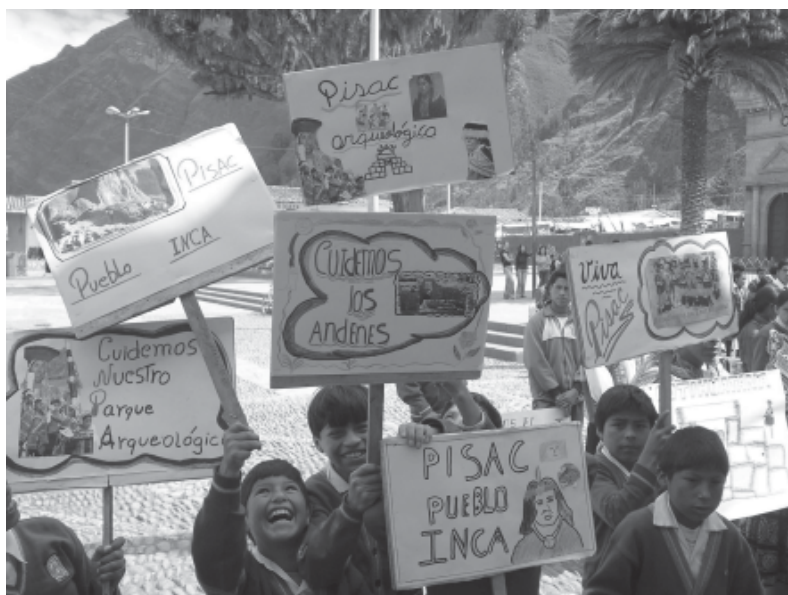
Figura 4. Niños en la Plaza Constitución, celebrando el Día Internacional de los Monumentos y Sitios en un día atípico, donde el espacio público fue liberado de la invasión pública.