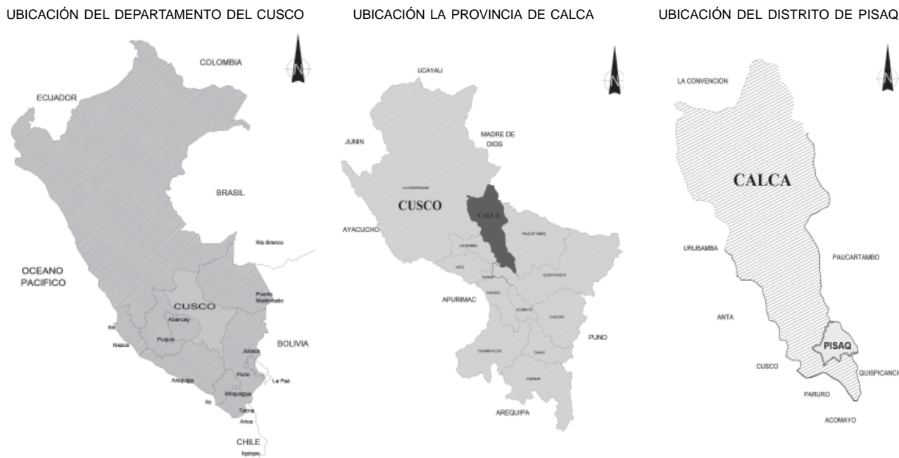
Figura 1. Plano de ubicación del distrito de Písaq.