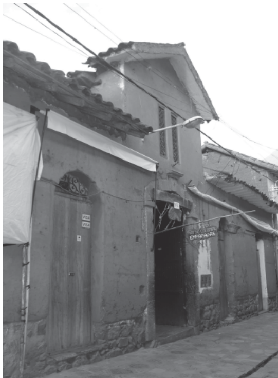
Figura 9. Vista de la fachada del horno en un día atípico, obsérvese la adecuación de materiales extraños como plásticos que terminan por contaminarlo.

Fuente: Archivo fotográfico personal, 2016.