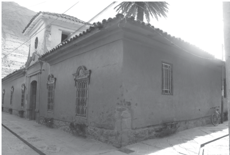
Figura 7. Vista panorámica de la casona, hallado en buen estado de conservación y adaptado actualmente para la visita turística sin que esto signifique la modificación de los ambientes.