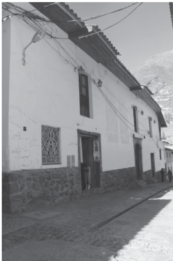
Figura 6. Vista panorámica de la casa Negrón Alonso, obsérvese el mal enrutamiento de los cables que terminan por contaminar su fachada.