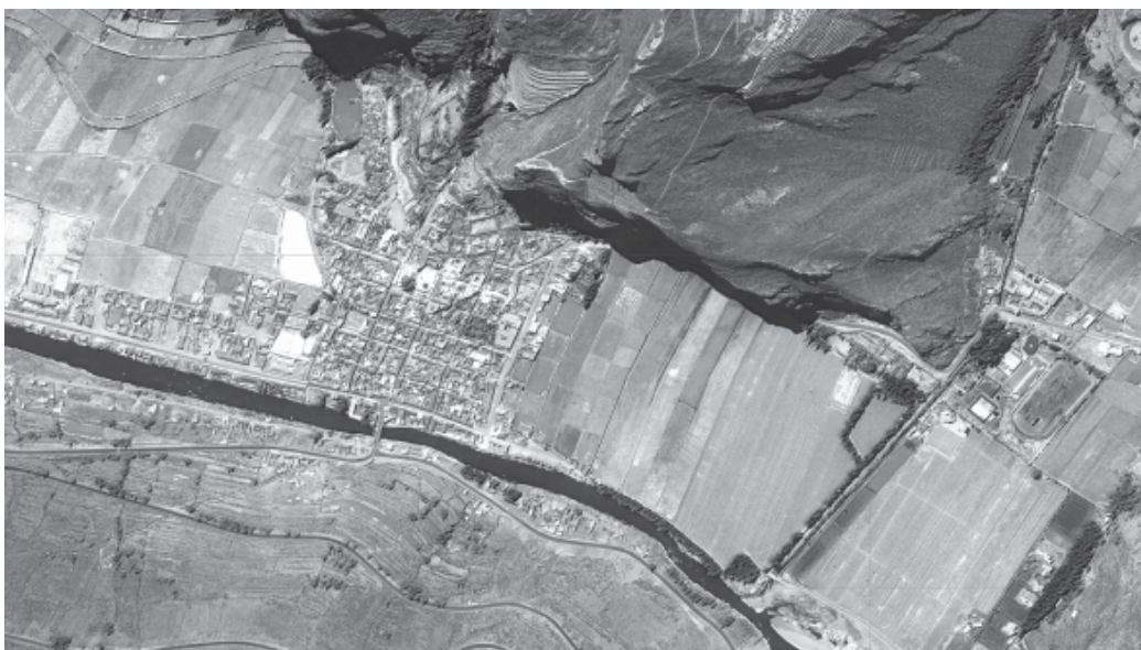
Figura 3. Vista aérea del poblado de Pisac.