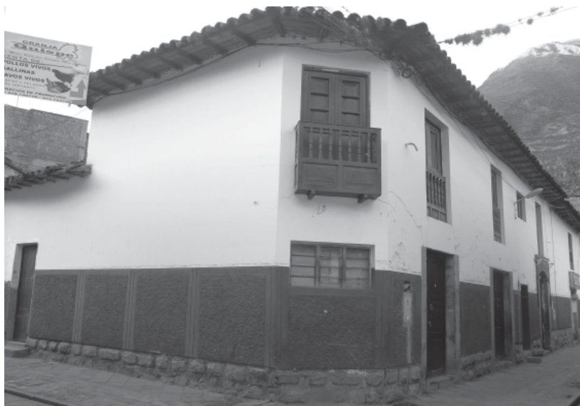
Figura 8. Vista panorámica de la casona, la cual aún conserva la esquina ochavada de la época, se halla en regular estado de conservación por la subdivisión y descuido de sus ambientes.